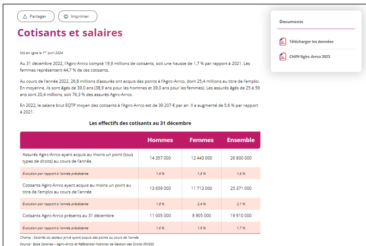
Figure 2 : Exemple pour la sous-rubrique « Cotisants et salaires »

Enfin, une grande majorité des données du Chiffre Agirc-Arrco sont reprises dans les deux modules de data visualisation 17 . Le premier module porte sur les actifs et le deuxième sur les retraités. Un