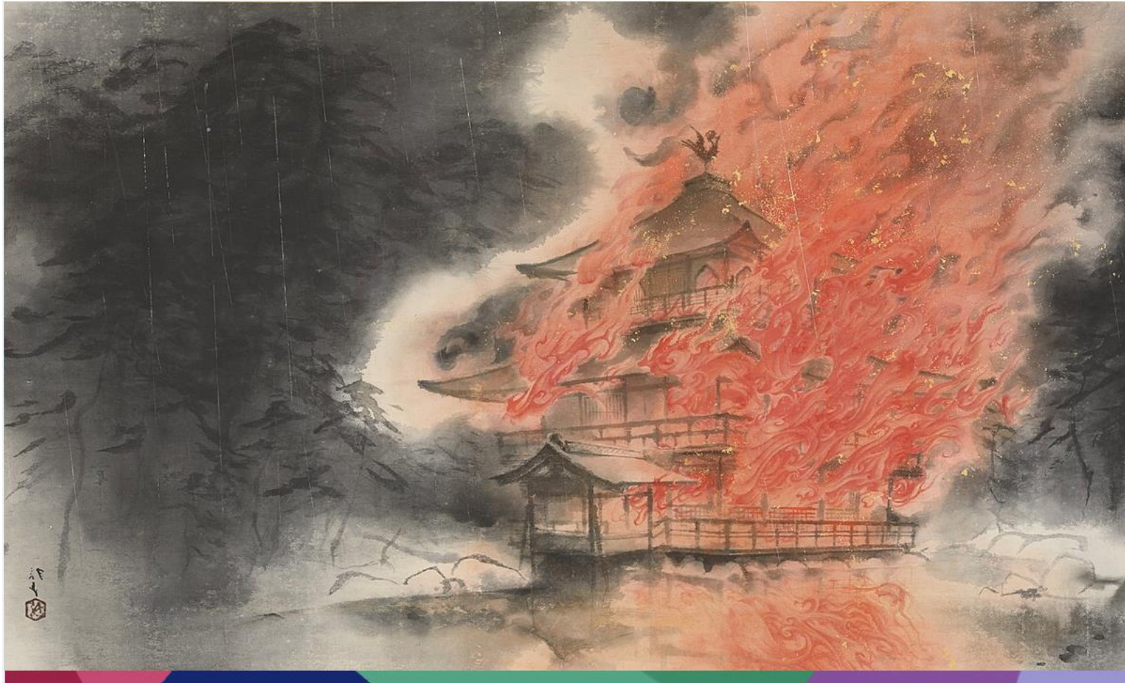
Ryūshi Kawabata, Le Pavillon d'or en feu , vers 1950, peinture, 142 x 239 cm, Musée national d'Art moderne de Tokyo